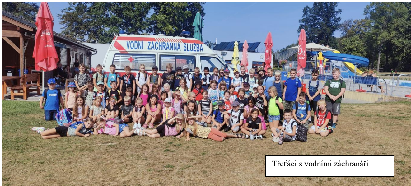
Třetáci s vodními záchranáři