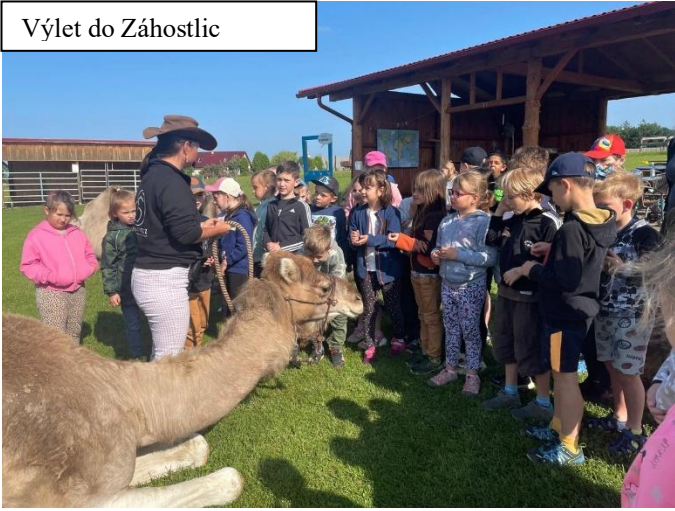
Výlet do Záhostlic