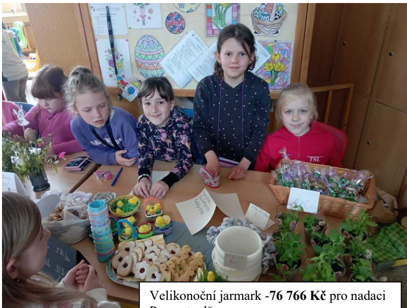
Velikonoční jarmark -76 766 Kč pro nadaci Pomozte dětem