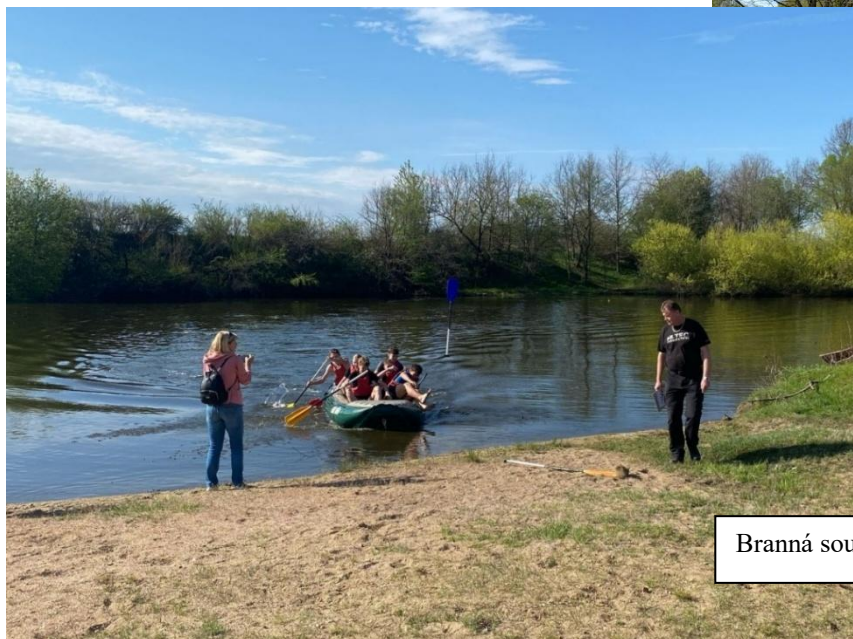
Branná soutěž POKOS