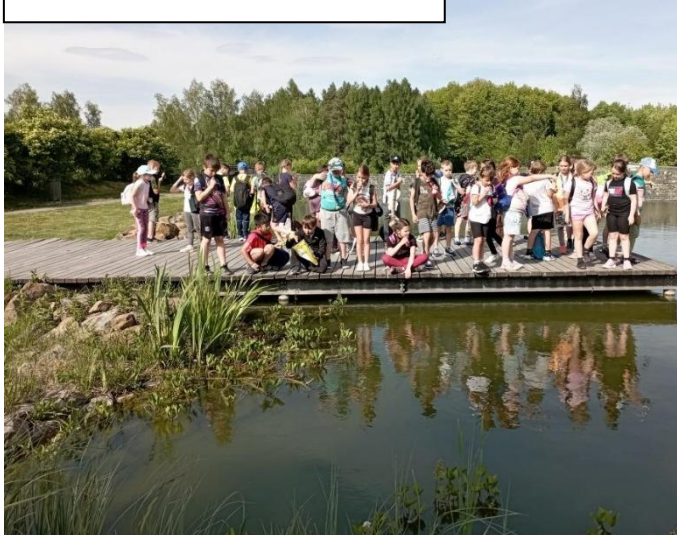
ŠD – výlet do Hulic (Vodní dům)